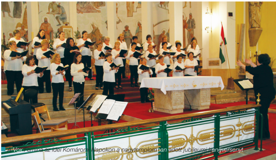
A Vox Femina az Idei Komárom Napokon a nagytemplomban adott jubileumi hangversenyt

AZ 1979 / 80-AS TANÉVBEN, KOMÁROM AKKORI VÁROSVEZETŐINEK KEZDEMÉNYEZÉSÉRE JÖTT LÉTRE AZ ÓVÓNÓKBÓL, TANÍTÓNÓKBÓL ÉS TANÁRNÓKBÓL ÁLLÓ PEDAGÓGUS NŐIKAR, KÉSŐBBI NEVÉN VOX FEMINA NŐI KAR. FONTOS ÁLLOMÁS ÉLETÜKBEN AZ IDEI ESZTENDŐ, AMELYBEN NEGYVEN ÉVES FENNÁLLÁSUKAT ÜNNEPELHETIK.