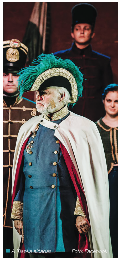
■ A Klapka előadás

Kétszázhusz felett, Santa Maria, Don Quijote, Pago Pago, Ha szombat este táncol, Tini-dal, Holnap hajnalig, Vándorének. Szintén a múlt hónapban ütős slágerekkel készült hódítani