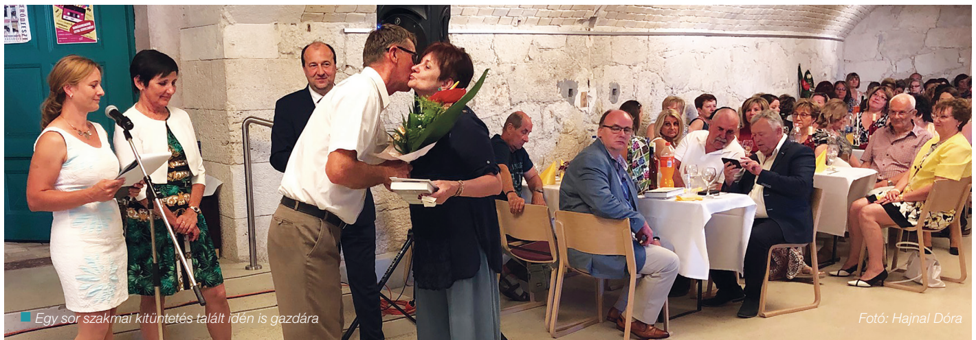
Egy sor szakmai kitüntetés-talált idén is gazdára