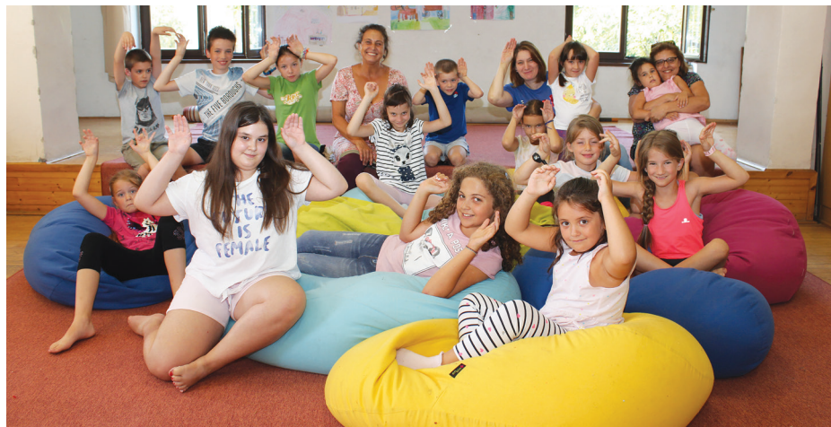
Minden gyermek elnyerte jutalmát a mesetáborban.