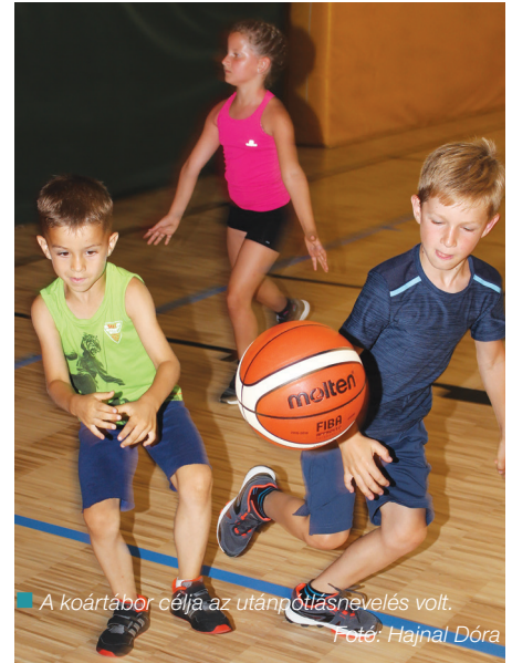
A koártábor célja az utánpótlásnevelés volt.