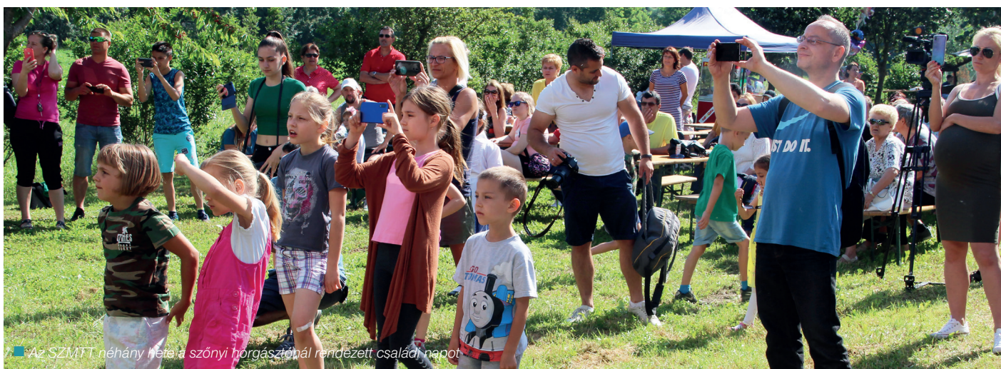
Az SZMTT néhány hete a szőnyi horgásztónál rendezett családi napot

Időközben az erős magból baráti társaság kovácsolódott, melyben rendezvények szervezésére is igény mutatkozott. Így kelt életre a tavalyi falukarácsony a Hősök terén, vagy a nyár eleji családi nap a szőnyi horgásztavon. – Tavaly fákat is ültettünk a molaji kerékpárút és a vasút közötti területen. Találkozóinkra vendégeket is hívunk: megismerkedtünk a komáromi mentőállomás vezetőjével, vagy a SZÓKE (Szőnyi Kulturális Egyesület) újonnan megválasztott elnökével. Tervezzük meghívni a kórházigazgató asszonyt, illetve szőnyi-molaji vállalkozókat. Összejöveteleinket mindig máshol tartjuk, így minden tagunk megismerhette a felújított bölcsődét, betekintheztünk az óvoda, iskola életébe, örülhettünk közösen, hogy a Máltai Szeretetszolgálat nappali intézménye megfelelő otthonra talált Szőnyben. Nyár eleji találkozónk egy kis piknikkel, kutyás-lovass bemutatóval, élő gitárzenével a Kemencés udvarban történt – mondta az alpolgármester, aki másokat is buzdít a csatlakozásra, akik tenni akarnak Szőnyért és Molajért.