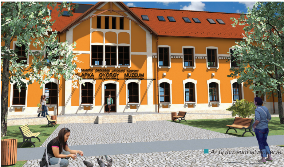
Az új múzeum látványterve.

A KOMÁROMI KLAPKA GYÖRGY MÚZEUM NÉHÁNY HÓNAP MÚLVA ÁTKÖLTÖZIK A VOLT MEZŐ- GAZDASÁGI KOMBINÁTBA. A TÉMÁBAN JÚLIUS ELEJÉN, A TERÜLET MŰSZAKI ÁTADÁSÁVAL EGYIDŐ- BEN TARTOTTAK SAJTÓTÁJÉKOZTATÓT.