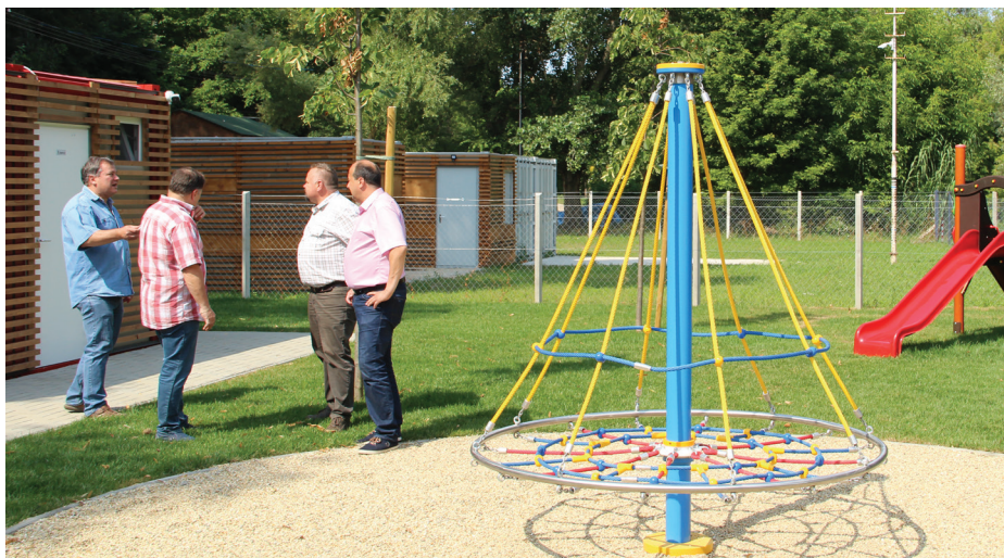
■ A hivatalos megnyitó előtt bejárást tartott az üzemeltető és a városvezetés a szabadstrandon

ELKEZDŐDÖTT A NEMRÉG MEGÚJULT SZABADSTRAND PRÓBAÜZEME, AMELY MINDEN NAP 9 ÉS 19 ÓRA KÖZÖTT VÁRJA A FÜRDŐZNI ÉS KIKAPCSOLÓDNI VÁGYÓKAT.