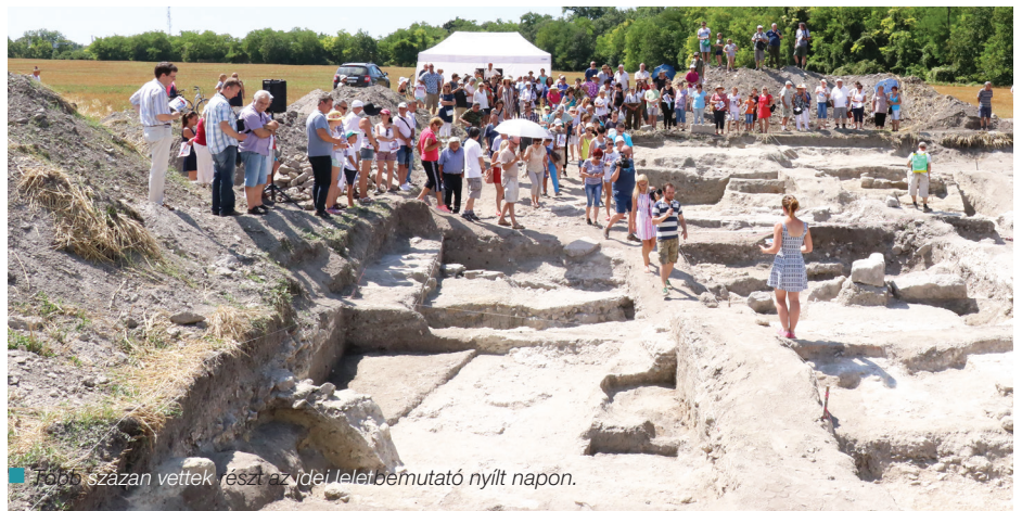
Több százan vettek részt az idej lelet bemutató nyílt napon.

A polgármester a helyiek türelmét kérte a munkálatok ideje alatt. Míután a terület közelében két óvoda is található, ezért az építkezést nagy körültekintéssel végzik majd a szakemberek. A munkálatok várhatóan jövő év második felére fejeződnek be.