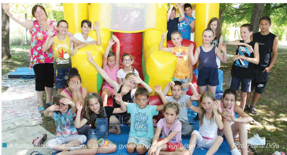
A máltais táborban a rászoruló családok gyerekei nyaraltak egy héten át.

A mese megmutatta számukra a láthatatlan dolgokat, és gondolatébresztésként arra is rájöhettek, hogy segítők, barátok nélkül semmit nem ér az élet. A mesés feladatokon keresztül megértették, hogy együttműködve tudnak boldogulni a mesevilágban, és az élet meséjében is.