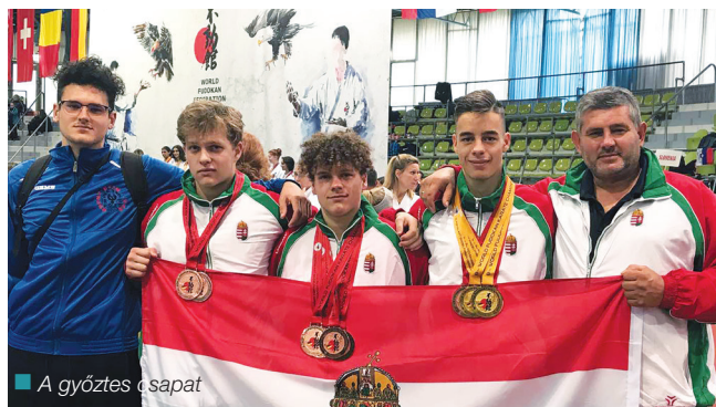
A győztes csapat

A KOMÁROMI KARATÉSOK AZ EGYESÜLET FENNÁLLÁSÁNAK LEGNAGYOBB SIKERÉT ÉRTÉK EL A VIII. FUDOKAN KARATE VB-N. HÉT ÉRMET HOZTAK!