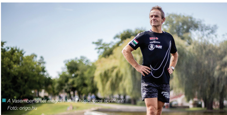
A Vasember ismét megcsinálta a hússzoros Ironmant!

KM KERÉKPÁROZÁSBÓL ÉS 844 KM FUTÁSBÓL ÁLLÓ HÚSSZOROS IRONMANT.