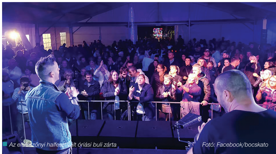
Az első szőnyi halfesztivált óriási buli zárta

HAL, HALÁSZAT, HAJÓZÁS, HALÉTELEK. OKTÓBER 26-ÁN MINDEN A HAL KÖRÜL FORGOTT A BOCSKA-TAVON. IGAZI KÖZÖSSÉGÉPÍTŐ RENDEZVÉNYT SZERVEZETT A BOCSKA CSALÁD.