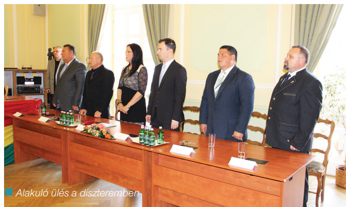
Alakuló ülés a díszteremben