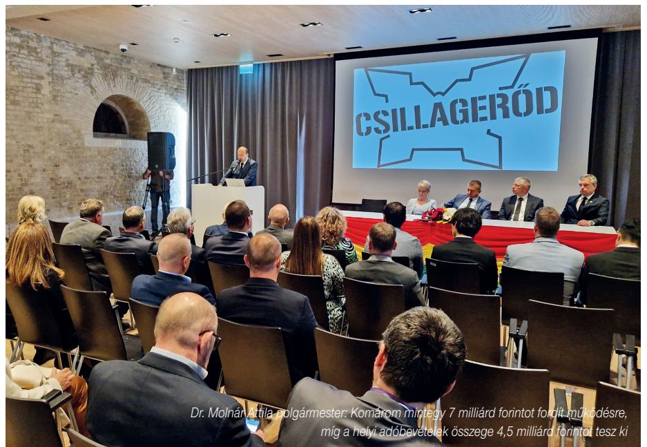
Dr. Molnár Attila polgármester: Komárom mintegy 7 milliárd forintot fordít működésre, míg a helyi adóbevételek összege 4,5 milliárd forintot tesz ki

Ipari teljesítményével városunk és térsége gazdasági kulcsterület. Az államtitkár a megbecsülést, a tiszteletet üzent a magyar Kormány részéről a dinamikusan működő komáromi vállalkozások felé. (ta)