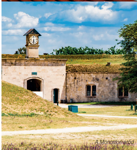
A Monostori erőd