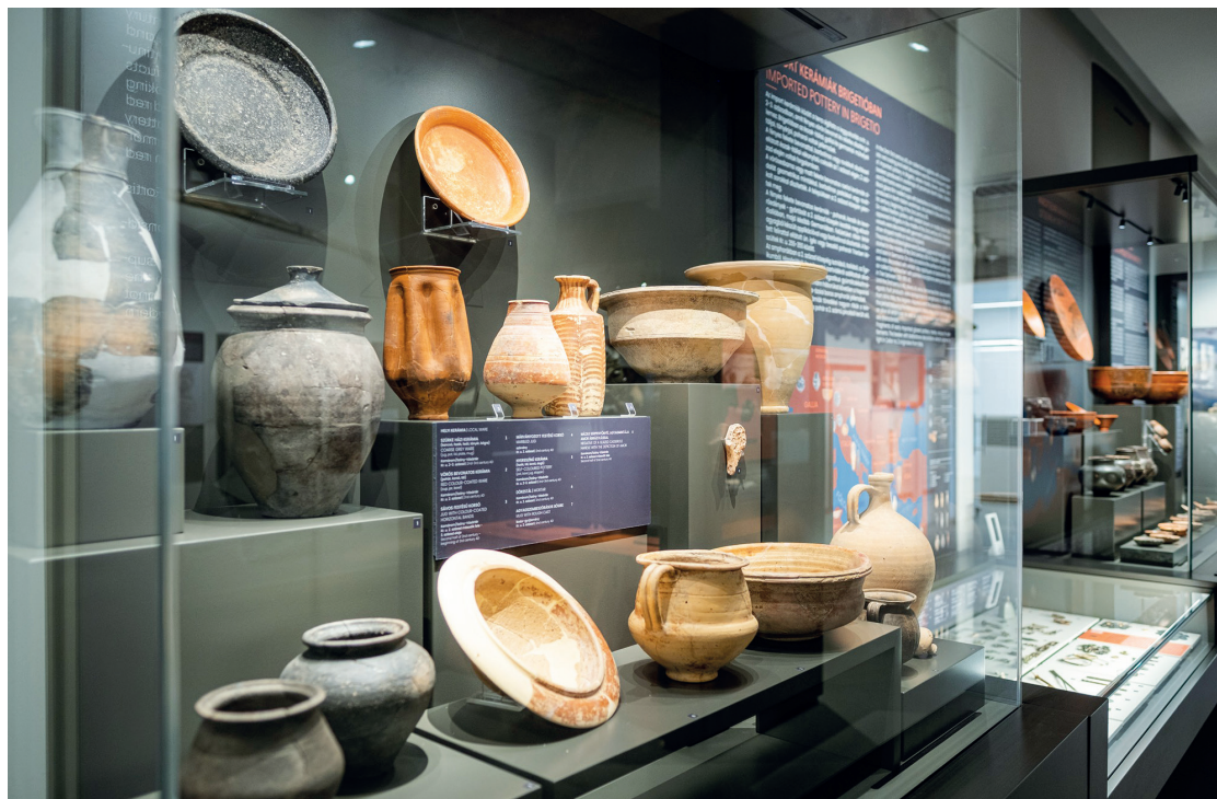
Az új múzeum megépítésével méltó, XXI. századi körülmények közé került Brigetio pártatlan leletanyaga.

Városunk központjában április 27-én átadták a Komáromi Klapka György Múzeum új kiállítóhelyét, a Brigetio Öröksége Látogatóközpontot, amelyet a hajdani Méntelep főépületéből alakítottak ki.