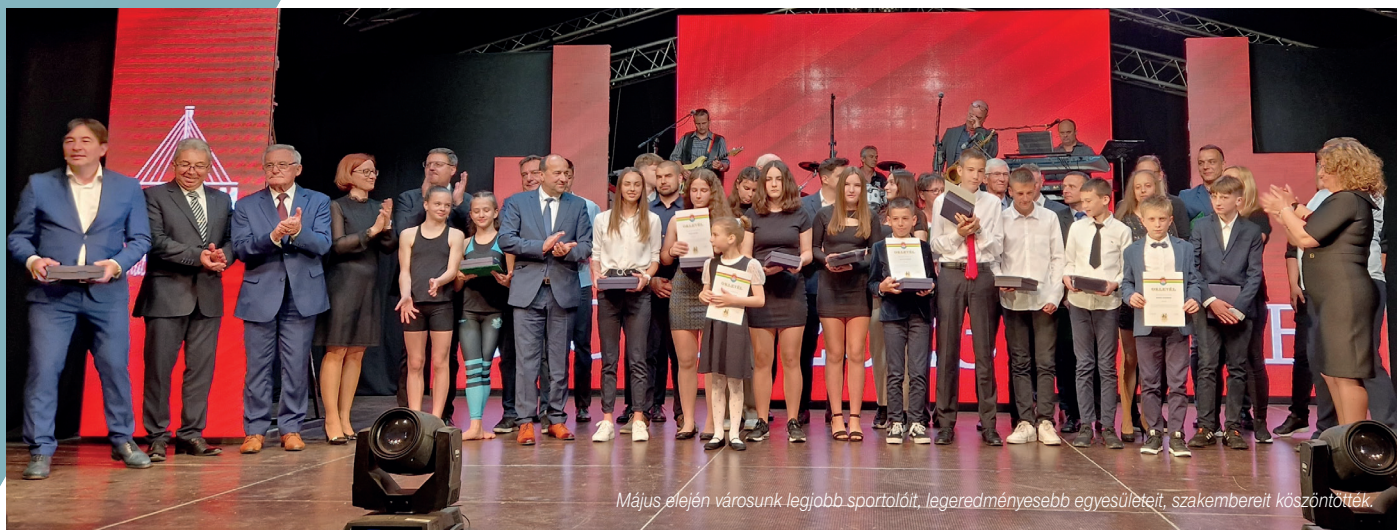
Május elején városunk legjobb sportolóját, legeredményesebb egyesületeit, szakembereit köszöntötték.

A magyar sport napján, május 6-án este rendezték a hagyományos Sportünnepet a Monostori erődben, a KlapkArénában. A város vezetése a Jó tanuló, jó sportoló diákjait, az év junior női és férfi sportolóját, az év edzőjét, az év csapatát, női és férfi csapatsportolóját, az év női és férfi sportolóját, az év testnevelőjét köszöntötte. Az ünnepi gálán adták át a Komárom Város Sportjáért díjat is.