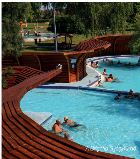
A Brigetio Gyógyfürdő.

Az oldal kezelői minden évben megnézik, hogy a portál látogatói mely települések eseménynaptárát keresték legtöbben.