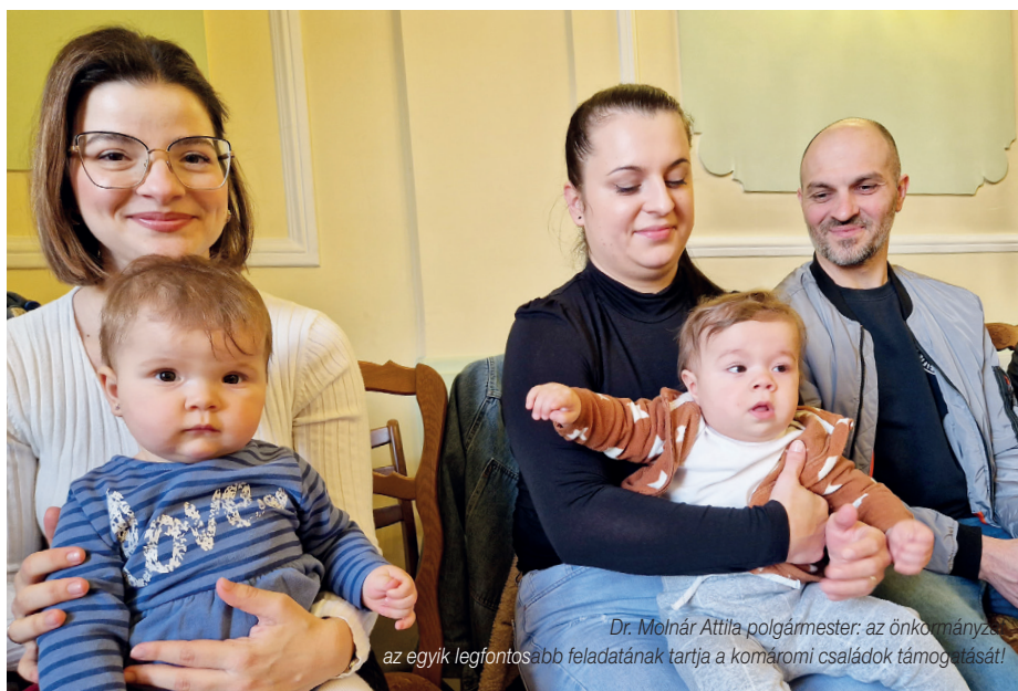
Dr. Molnár Attila polgármester; az önkormányzat az egyik legfontosabb feladatának tartja a komáromi családok támogatását!

Évek óta hagyomány az újszülöttek és családjaik megajándékozása Komáromban. Tavaly május végén a Jókai ligetben 170 kisbabát köszöntött az önkormányzat, azóta 45 baba született.