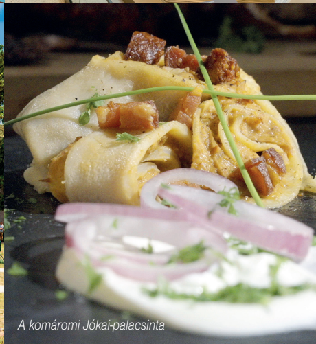
A komáromi Jókai-palacsinta