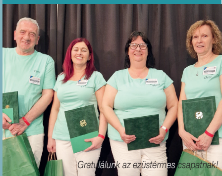
Gratulálunk az ezüstérmes csapatnak!

Nemrég 11. alkalommal került rendezték a Magyar Egészségügyi Szakdolgozói Kamara Országos Szakmai Verseny döntője Budapesten, a Lurdy Házban, melyen 20 csapat 80 versenyzője mérte össze tudását. Komárom-Esztergom vármegyét a Selye János Kórház, Kastély Angyalai csapata képviselte, melynek tagjai valamennyien a szőnyi kórház járó és fekvőbeteg ellátásának munkatársai.