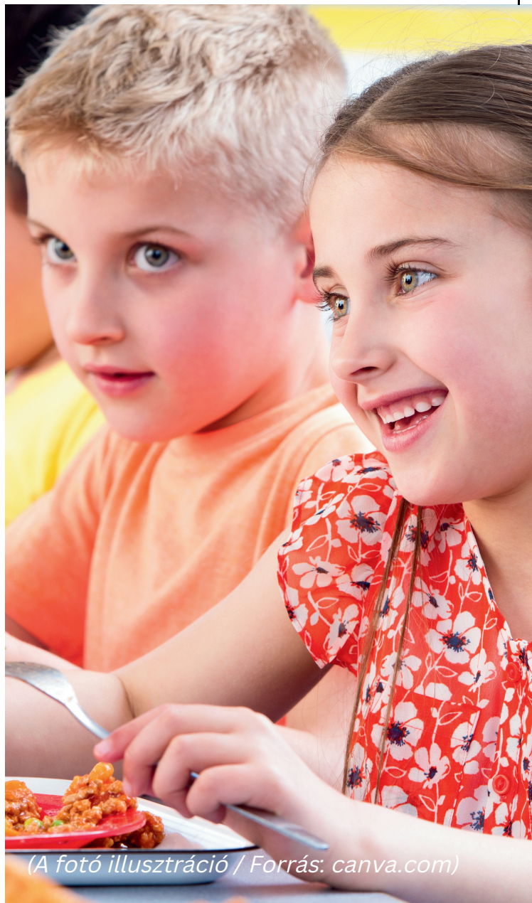
(A fotó illusztráció /)