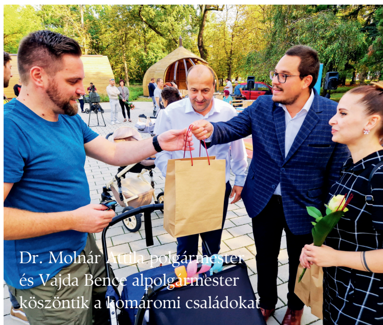
Dr. Molnár Árpád polgármester és Vajda Béni alpolgármester köszöntik a komáromi családokat

Az önkormányzat a bölcsődei és az óvodai közétkeztetés díjának átvállalja a családoktól