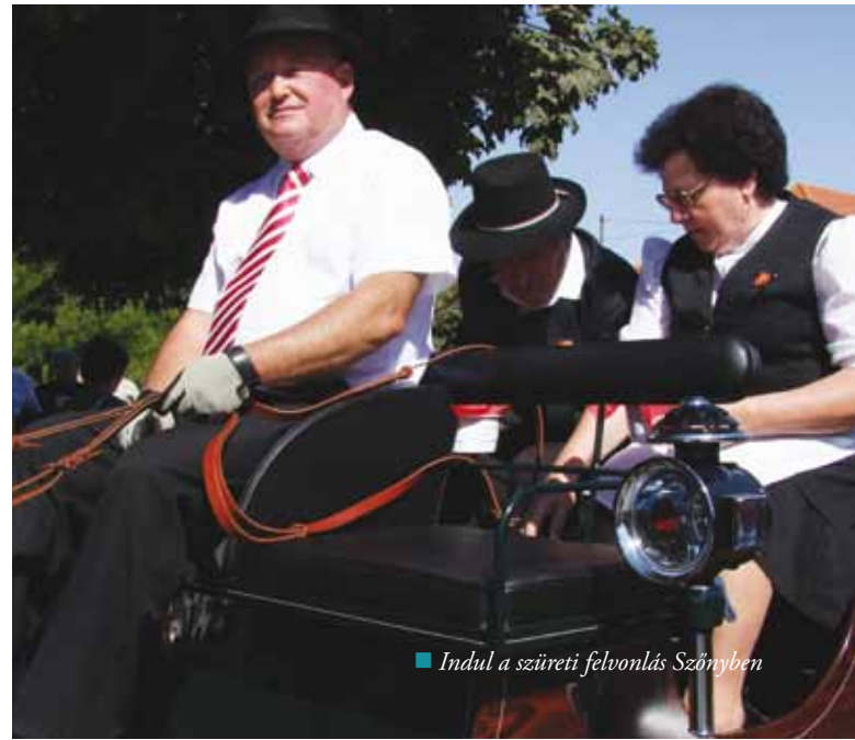
■ Indul a szüreti felvonulás Szőnyben

Az elmúlt hetekben szinte minden hétvégére jutott valami program a városban. Az augusztusi koppánymonostori falunapot követően Szőnyben szüreti felvonulást tartottak, míg a MOL városrészben a Cathedra nap várta a családokat.