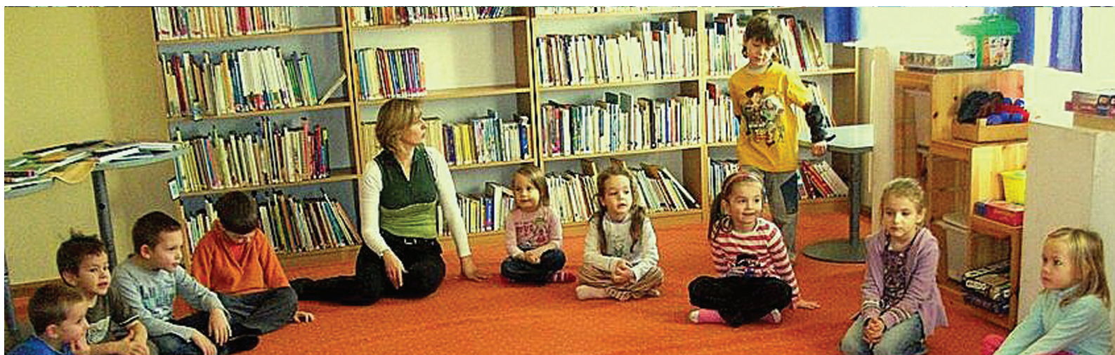
Június 5-vel véget ért "A Jókai Mór Városi Könyvtár részvétele a tanórán kívüli nevelési feladatok ellátásában" nevet viselő projekt, ami két év alatt összesen 140 eseményen több mint 1600 fiatalot vont be programjaiba.

Komárom Város Önkormányzatának pályázatát a Humán Erőforrás Programok Irányító Hatóságának vezetője 10 millió Ft, vissza nem térítendő támogatásra érdemesnek ítélte. A projekt megvalósítása 2012 novembere és 2014 júniusa között zajlott. A programba öt oktatási-nevelési intézmény, a Feszty, a Móra és a Petőfi iskola, a Tóparti Óvoda és az ászári Jászai Mari Iskola vett részt. A másfél évig zajló sorozatban 140 eseményen összesen 1660 fiatal vett részt