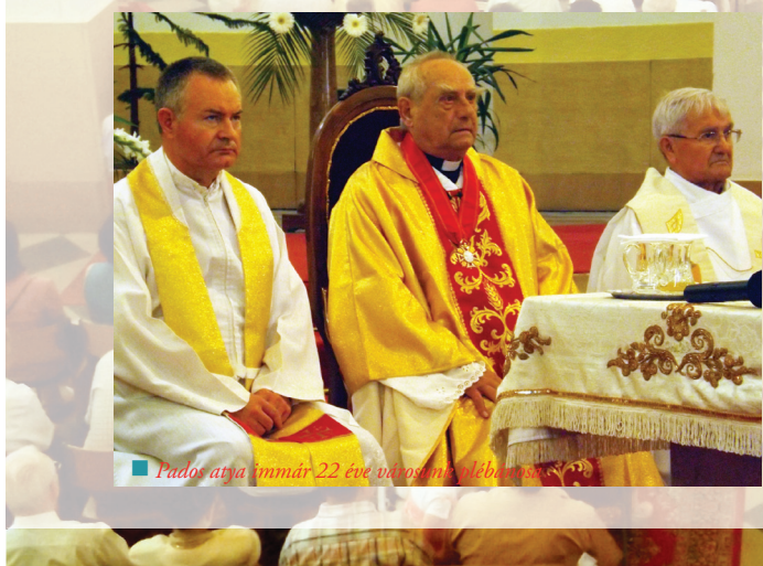
Pados atya immár 22 éve városunk plébánosa