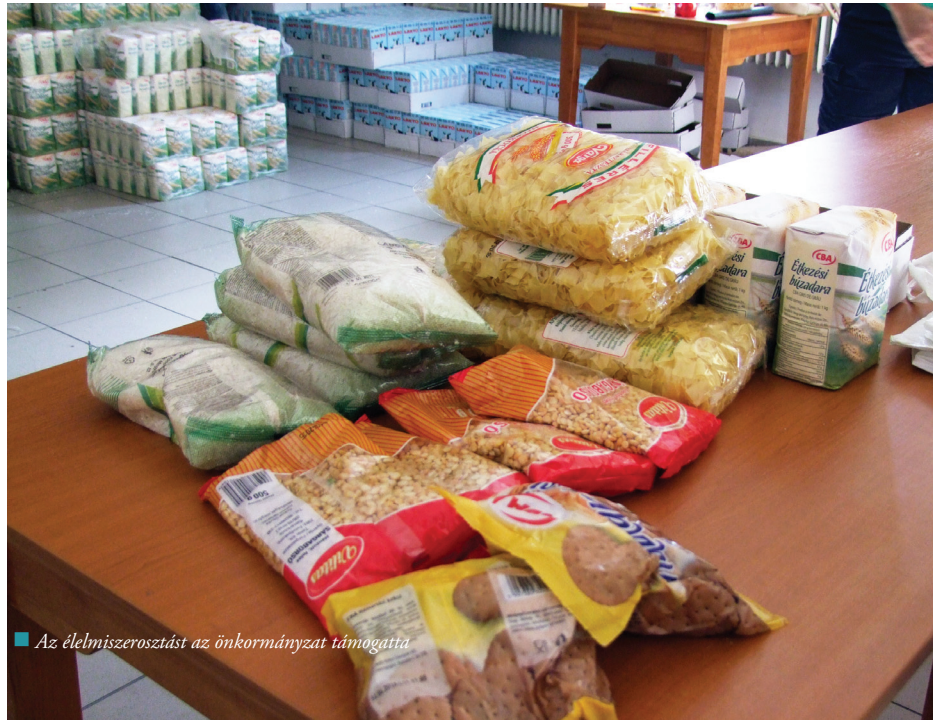
Az élelmiszercsomagot az önkormányzat támogatta

Június 11-én és 12-én ismét élelmiszercsomagot osztottak a Csonkai Művelődési Központban a rászoruló családoknak. Az eseményt a Komárom és Környéke Családsegítő és Gyermejköltségtérítési Szolgálat szervezte, és az önkormányzat finanszírozta.