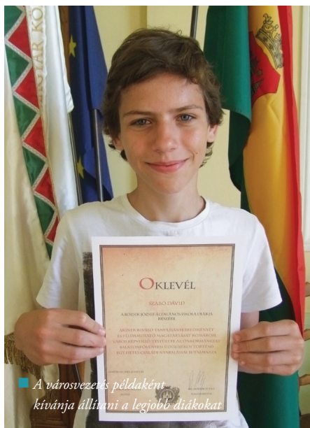
A városvezetés példaként kívánja állítani a legjobb diákokat

Városunk tíz kiválóan teljesítő általános- és középiskolása idén is kiérdemelte, hogy családjával egy hetet tölthessen el az önkormányzat balatonfővenyesi üdülőjében. Az oklevelek ünnepélyes átadására június 11-én a városházán került sor.