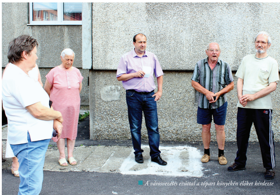
■ A városvezetés ezúttal a tópart környékén élőket kérdezte