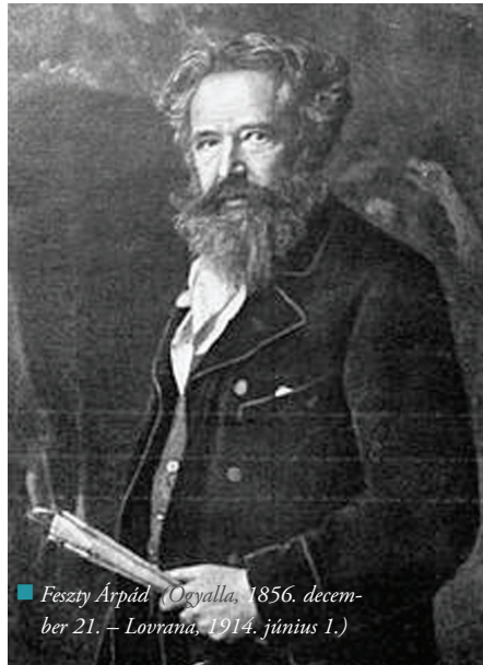
■ Feszty Árpád. (Ógyalla, 1856. december 21. – Lovrana, 1914. június 1.)

- Hongkongban az idő pénz, így mindenki rohan. Itt nyugodtabb az életvitel, több idő marad a pihenésre. Az iskola-rendszer is más. Nálunk 6 évig kötelező az általános iskola, 6 évig a középiskola és 3-4 év az egyetem. 10 évet éltem Londonban a nagynénémnél, mert ő nevelt fel. Most hazamegyek, hogy befejezzem az egyetemet. Attól függően, hogy hol találok állást, Ázsiában maradok, vagy visszajövök Európába - mondta Keung. A fiatalok a következő hónapokban ellátogatnak Csehországba, Lengyelországba, Svájcba, Németországba és Olaszországba is. (se)