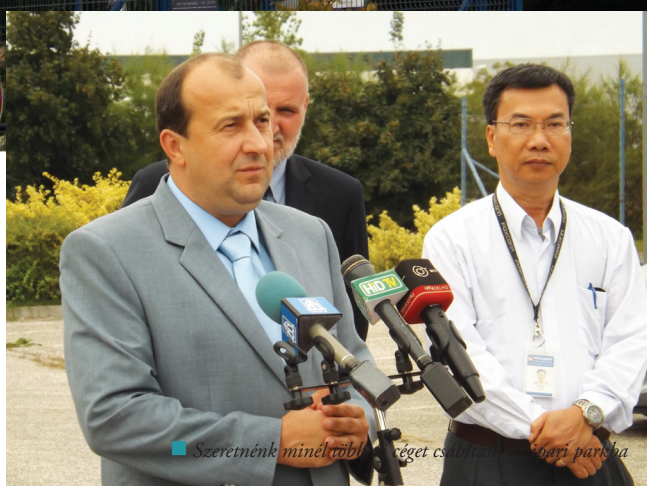
Szeretnénk minél több új céget csábítani az ipari parkba

SZEPTEMBER ELSEJÉTŐL 400 FŐVEL BŐVÍTI DOLGOZÓI LÉTSZÁMÁT KOMÁROMBAN A FOXCONN. A SZÁMÍTÁSTECHNIKAI ESZKÖZÖKET GYÁRTÓ CÉG TELJES EGÉSZÉBEN VÁROSUNKBA HELYEZTE ÁT A TERMELÉST, A VÉRTES VOLÁN ZRT. PEDIG, REAGÁLVA A GYORSAN VÁLTOZÓ PIACI HELYZETRE, ÚJ MENETREND SZERINTI AUTÓBUSZJÁRATOKAT INDÍTOTT.