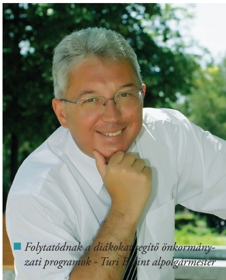
Folytatódnak a diákokat segítő önkormányzati programok - Turi E. János polgármester

Két tanévvel ezelőtt az első, az ötödik és a kilencedik évfolyamon került bevezetésre. Így tehát jelen tanévtől az 1-3, 5-7 és 9-11. évfolyamokon már minden napra jut egy testnevelés óra a diákoknak.