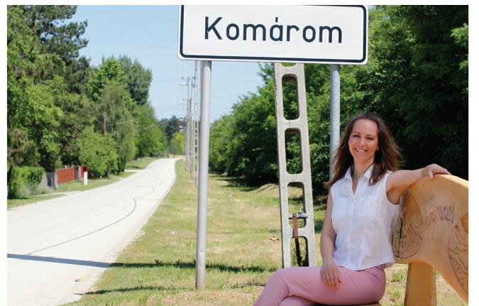
A Szent Család Közösség mindennapjai

Baba-mama klubból indult, mára viszont kicsiket, anyukákat és apukákat tömörítő csoporttá vált a Szent Család Közösség, akik szívesen töltik együtt mindennapjaikat. Életüket nagymértékben befolyásolja a katolikus hitélet, azonban szívesen maguk közé fogadnak bárkit, aki elfogadja nézeteiket.